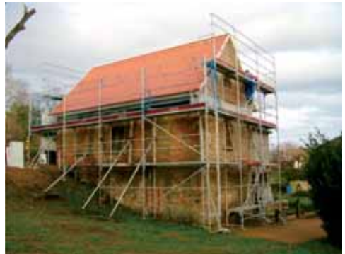
Sinnvoll angelegt! Die ersten Baufortschritte sind zu erkennen. Das neue Dach ist nahezu fertiggestellt, Richtfest gefeiert, nun kann der Winter kommen.

Der Verein „Crumbacher Denk-Mal!“ sagt herzlichen Dank an den FC Bayern Fanclub Gersprenztal/Odenwald.